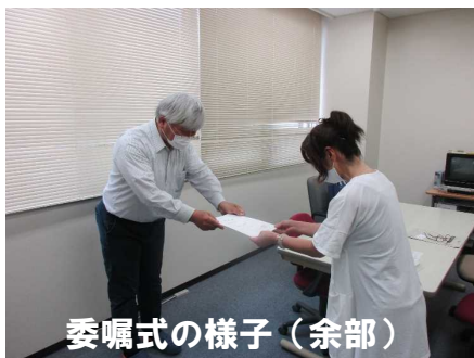
委嘱式の様子(余部)