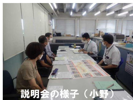
説明会の様子(小野)