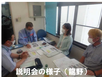
説明会の様子(龍野)