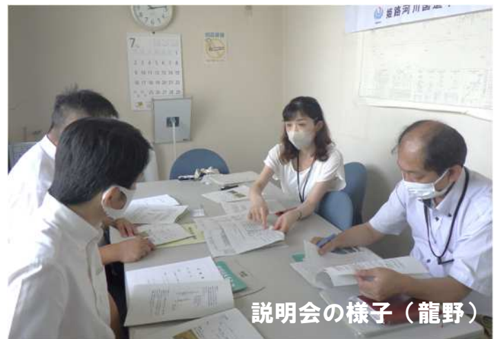
説明会の様子(龍野)