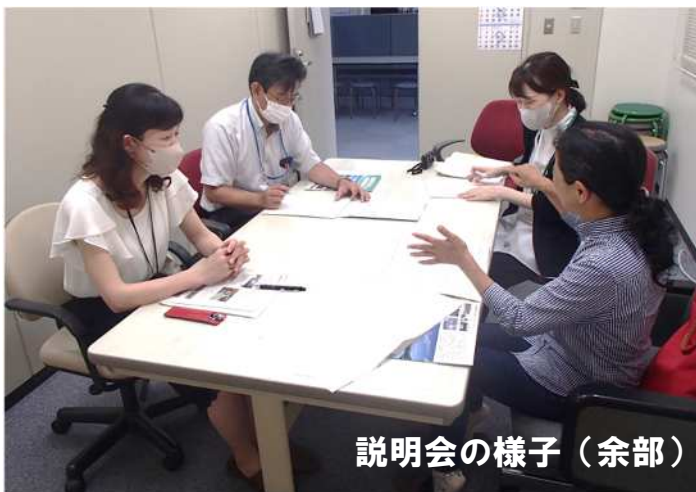
説明会の様子(余部)