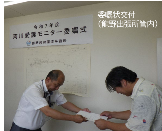
委嘱状交付 (龍野出張所管内)