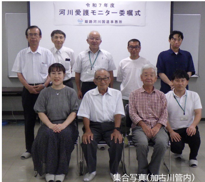
集合写真(加古川管内)