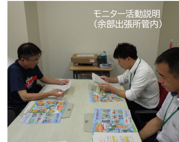
モニター活動説明 (余部出張所管内)

モニター活動の内容や河川利用のルールなど、様々な質問がよせられ、職員と意見を交換を行いました。