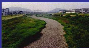
林田川（平成13年）水涸れが発生