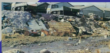
萱橋付近（昭和50年代）ヘドロやごみが堆積