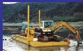
河床のヘドロ除去（国交省）