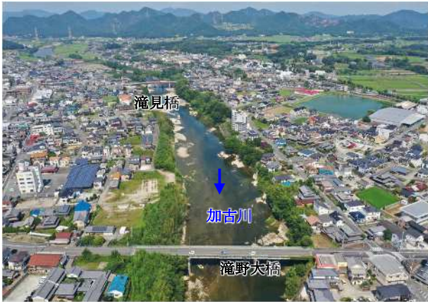
整備前(上滝野地区 滝野大橋上流)