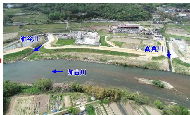
整備後(河高・下滝野地区付近)