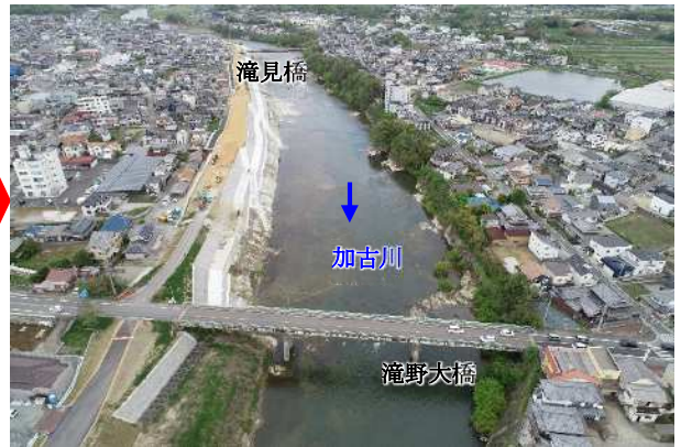
整備後(上滝野地区 滝野大橋上流)