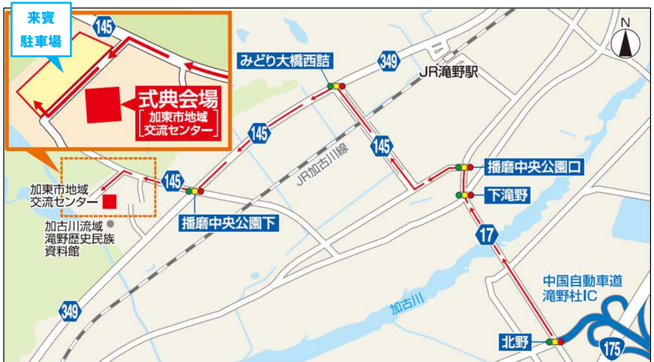
【式典会場周辺拡大図】