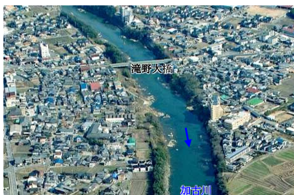
整備前(下滝野地区付近)