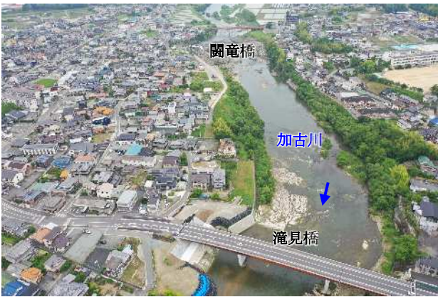
整備前(上滝野地区 滝見橋上流)