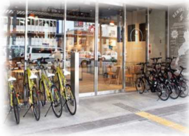
サイクルステーションの活用