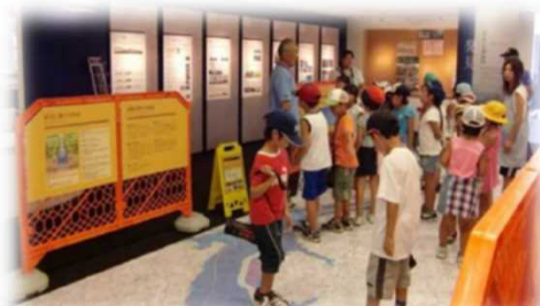
防災体験学習等の開催