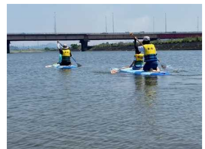
令和4年度のイベント風景

9月、10月には堤防上でキッチンカーを集めた社会実験（加古川 de リバー kitchen）を開催します。