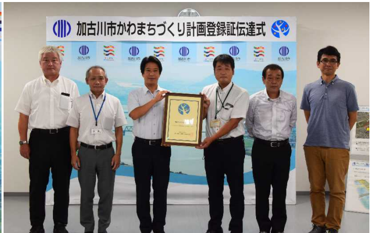
姫路河川国道事務所長