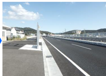
若狭野交差点付近（R4年11月2日撮影）