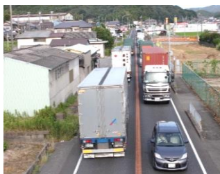
野々交差点付近（H23年7月13日撮影）