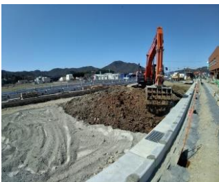
道路改良工事の実施状況