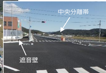
中央分離帯・遮音壁の設置状況（若狭野交差点付近）

当該区間の整備については、平成29年より工事着手しており、これまで延べ28者（設計コンサル13者、工事施工15者）に設計・施工等に携わっていただきながら、無事に整備することができました。ありがとうございました。