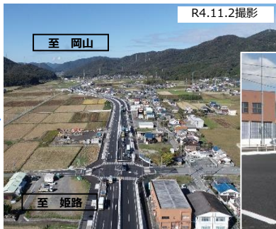
若狭野交差点付近の状況（整備後）