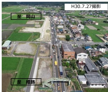
若狭野交差点付近の状況（整備中）