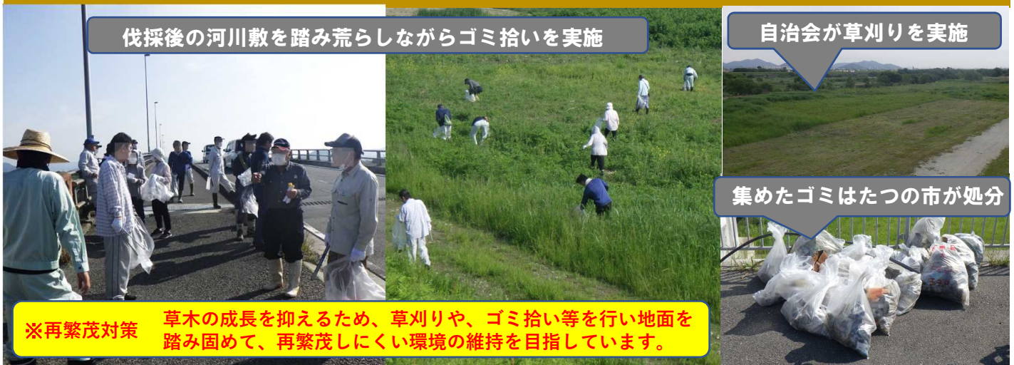
伐採後の河川敷を踏み荒らしながらゴミ拾いを実施