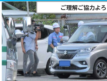
ご理解ご協力よろしくお願いします！