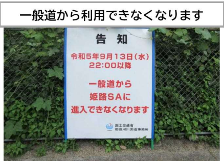
一般道から利用できなくなります