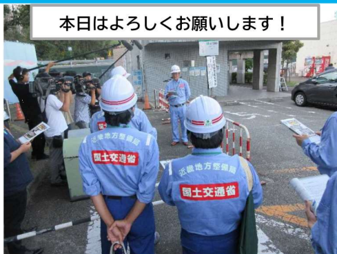
本日はよろしくお願いします！