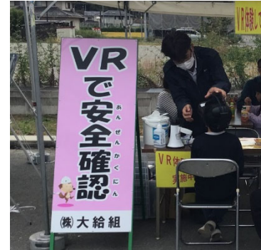
▲「VRで安全確認」。まるで作業現場にいるみたい。