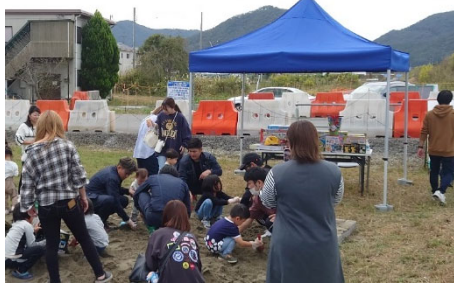
▲「砂から宝探し」。景品が当たりますように。