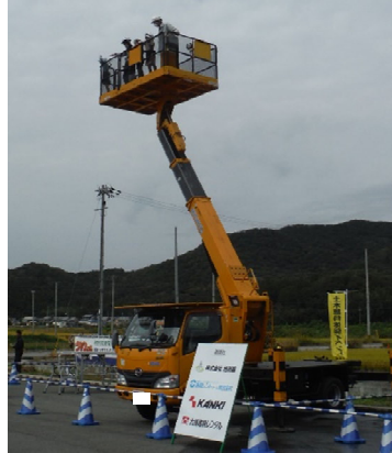
▲「高所作業車体験」。ナイスビュー！