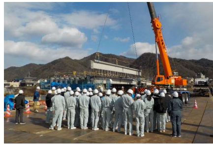
▲ 桁架設を見学！ 長さ21.5m・重量約23tもあります！