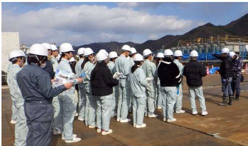
▲ 工事現場の概要説明 (株)日本ピーエス