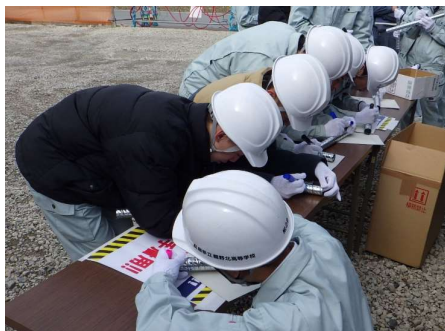
▲ 工事で使用する材料に願い事など を書いてもらいました！