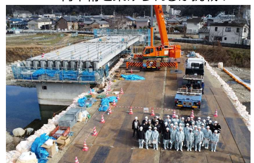
▲ 建設中の橋梁と一緒に写真撮影！