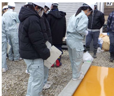
▲ 架設中の橋 (PC橋) の特徴を "ぴよんぴよん板"に乗って体感！