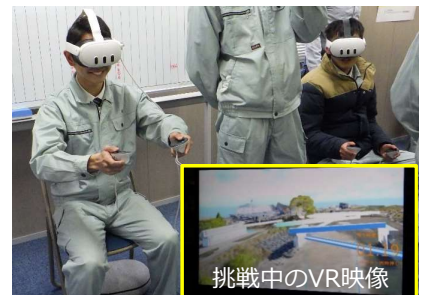
▲ VR架設シミュレータを操作して 何本桁を架けられるか挑戦！