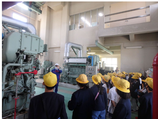
馬路川排水機場 内部の見学