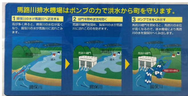
水害からの避難・排水機場の役割を学習