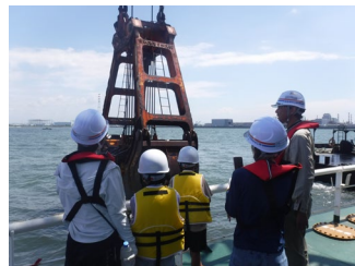
※川底を掘るバケット