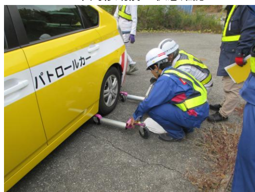
▲ ゴージャッキを使用した車両移動訓練