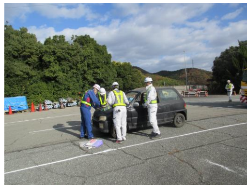
▲ 車両移動前の状態確認