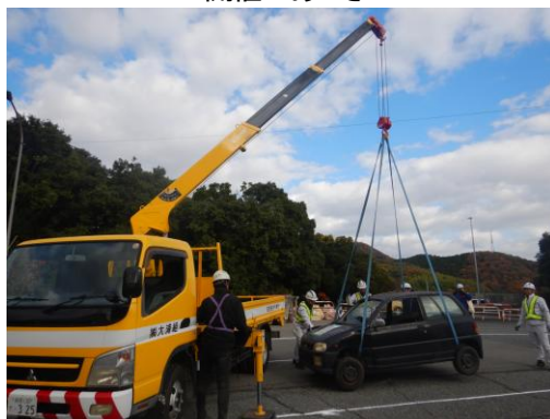
▲ ユニック車による車両移動