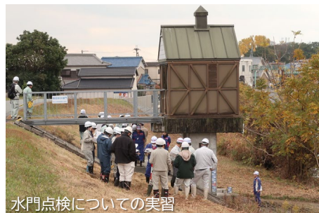
水門点検についての実習