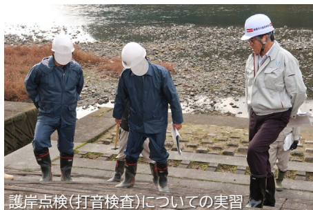
護岸点検(打音検査)についての実習