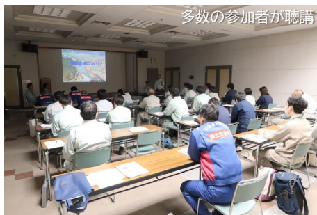
多数の参加者が聴講