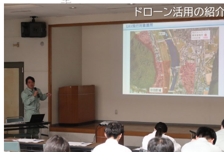
ドローン活用の紹介