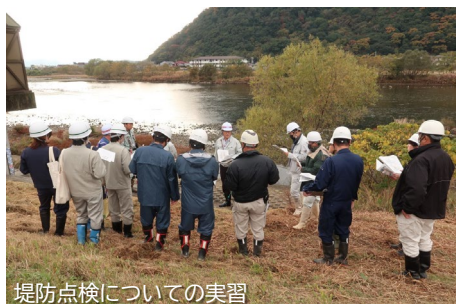
堤防点検についての実習