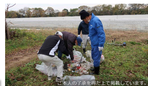
揖保川三川分派地区環境を守る会による揖保川の除草、清掃活動