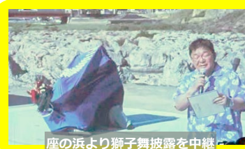
座の浜より獅子舞披露を中継