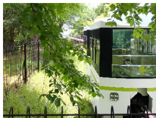
▲ミニモノレール (国見の森公園)