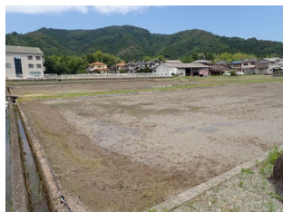
ひじょうり ▲比地条里 城下平野南部の条里制跡。「比地」の意味は泥土