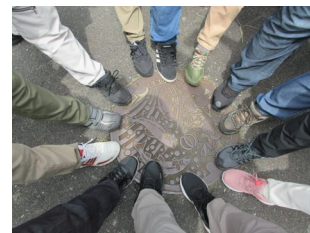
▲恒例のマンホールタッチ