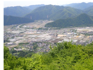
くみに ▲国見山の山頂展望台 宍粟市の街並みや揖保川を一望