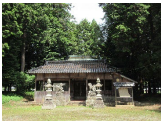
いわた ▲岩田神社 上比地の段丘端に鎮座している神社