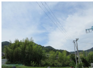
かがんだんきゆう ▲河岸段丘 比高差10～15mの階段状の崖