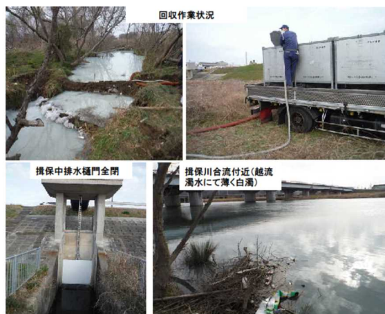
▲実際の水質事故対応