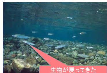
生物が戻ってきた