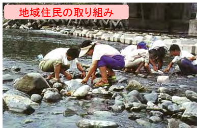
地域住民の取り組み