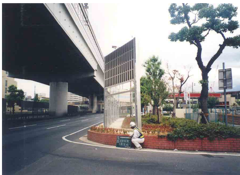
写真4 芦屋市平田北町の事例（平成14年度設置箇所）