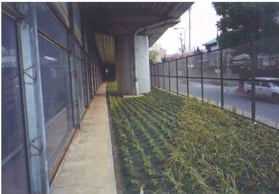
写真5 西宮市宮前町の事例（平成14年度補植箇所）