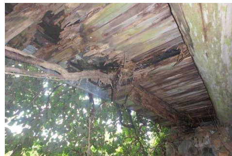
損傷状況(主桁の欠損)