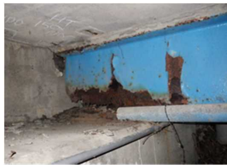
損傷状況(主桁の腐食)