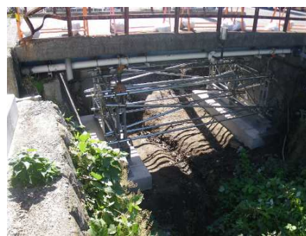
緊急対応の状況(支保工)