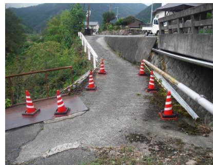
緊急対応の状況(幅員規制)