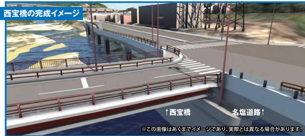
武庫川上流から国道176号ならびに西宝橋接続部方向