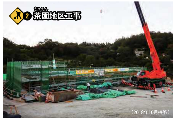
2 茶園地区工事 市道の付け替えのため、名塩道路下に横断ボックスの設置工事を行っています。