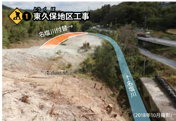
1 東久保地区工事 名塩川を付け替えながら、改良工事を行っています。