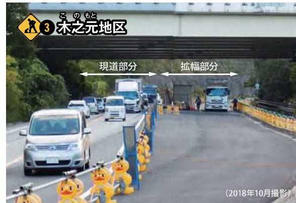
3 木之元地区 通行車線を切り替えながら順次4車線化を進めていきます。