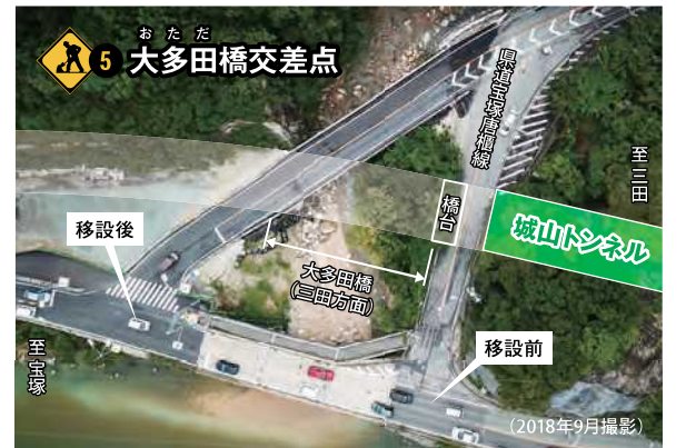
5 大多田橋交差点 おただ大多田橋(三田方面)の橋台を施工する際、県道宝塚唐櫃線に影響を与えないように、交差点を移設して工事を進めています。