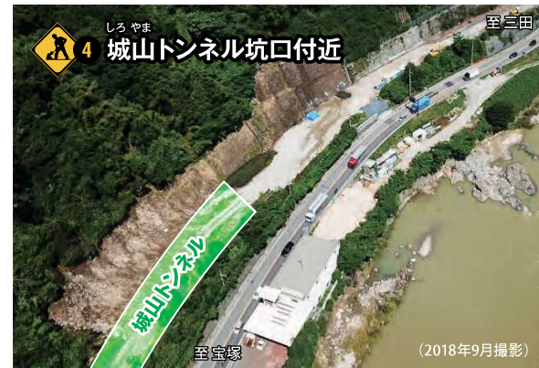
4 城山トンネル坑口付近 城山トンネル工事に向けて、改良工事を進めています。