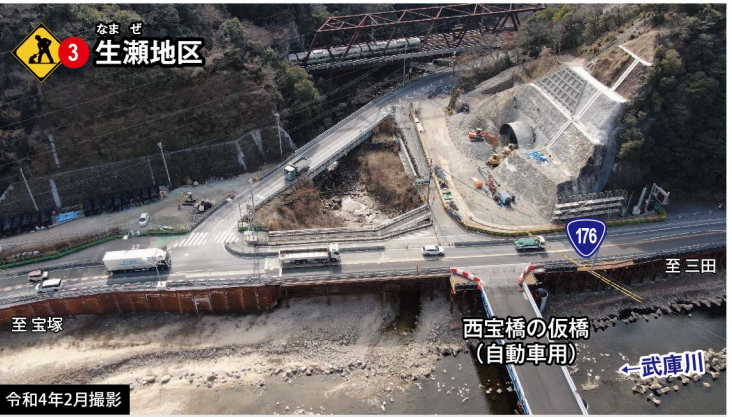
生瀬トンネル入口の工事を行っています。