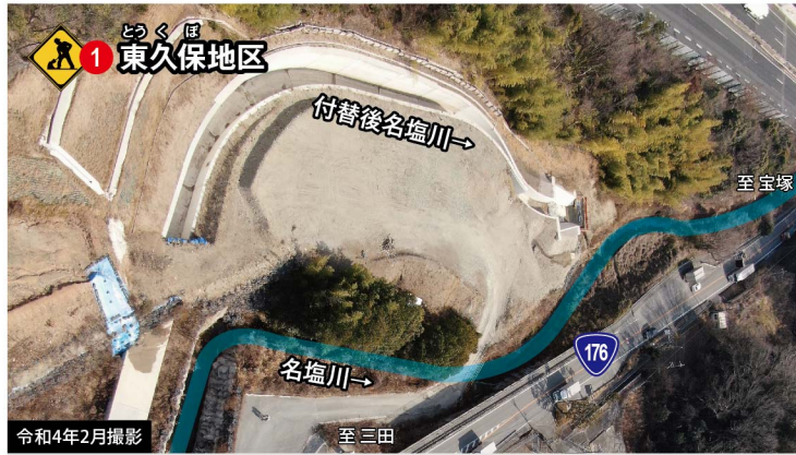
名塩川を付け替えながら、道路改良工事を行っています。