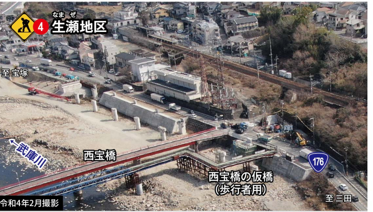
道路を拡幅するための橋脚工事を行っています。