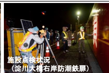
施設点検状況 (淀川大橋右岸防潮鉄扉)