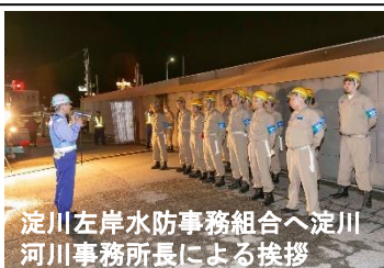
淀川左岸水防事務組合へ淀川 河川事務所長による挨拶