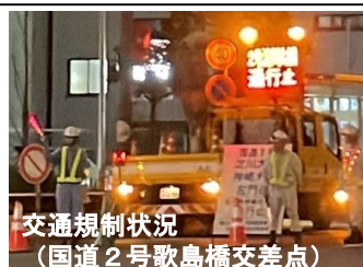
交通規制状況 (国道2号歌島橋交差点)