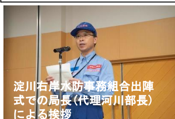
淀川右岸水防事務組合出陣 式での局長(代理河川部長) による挨拶

うち淀川河川事務所職員53名、大阪国道事務所職員41名、兵庫国道事務所職員28名