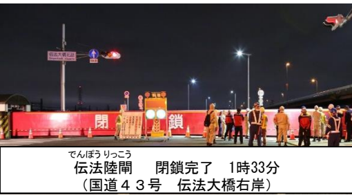
でんぼうりっこう 伝法陸閘 閉鎖完了 1時33分 (国道43号 伝法大橋右岸)