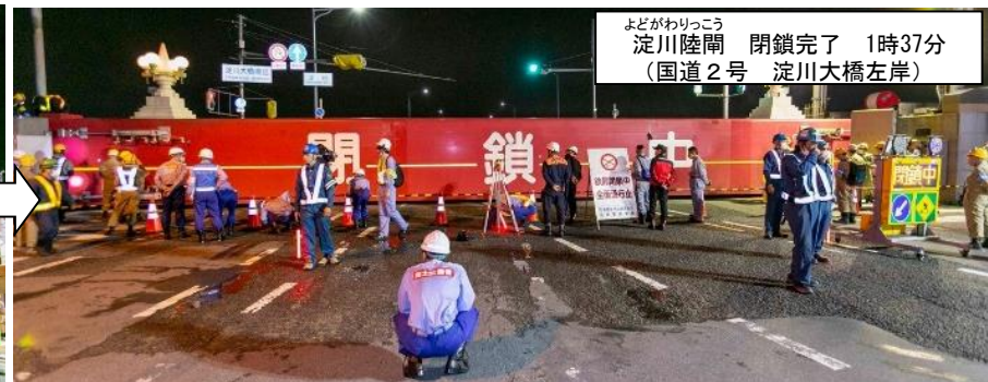
よどがわりっこう 淀川陸閘 閉鎖完了 1時37分 (国道2号 淀川大橋左岸)

■実施日： 令和5年7月1日(土) 22:30～2日(日) 3:00 (交通規制7月2日(日) 1:00～2:30)