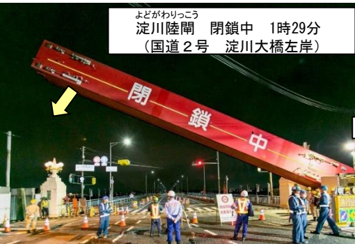
よどがわりっこう 淀川陸閘 閉鎖中 1時29分 (国道2号 淀川大橋左岸)