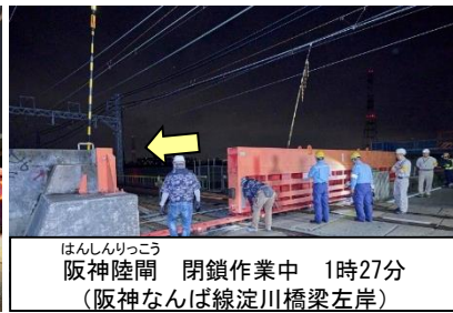
はんしんりっこう 阪神陸閘 閉鎖作業中 1時27分 (阪神なんば線淀川橋梁左岸)