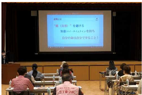
<講習会会場の様子>