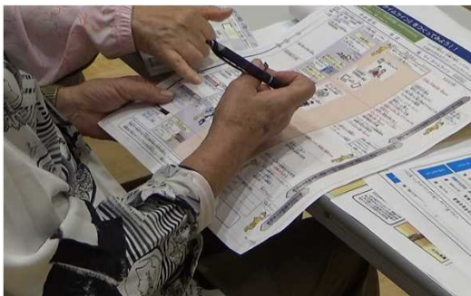
<マイ・タイムラインを作成する参加者>