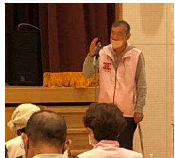
<挨拶をされる地区長>