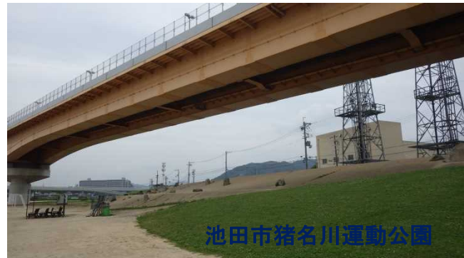
池田市猪名川運動公園

猪名川の水辺で何かしたいと考えている皆さん、 7月7日午後7時7分に『乾杯』しましょう！