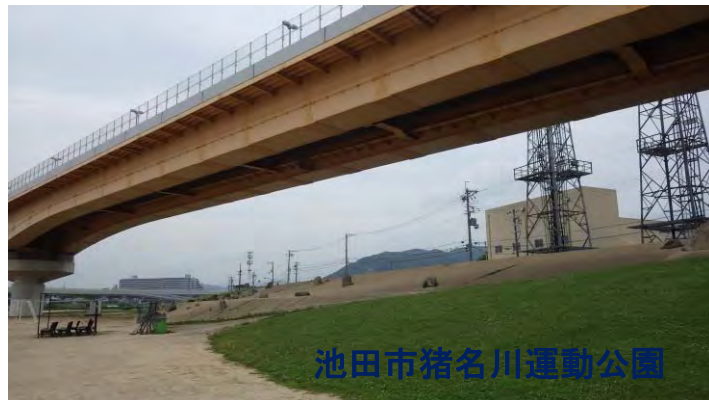
池田市猪名川運動公園

猪名川の水辺で何かしたいと考えている皆さん、7月7日午後7時7分に『乾杯』しましょう!