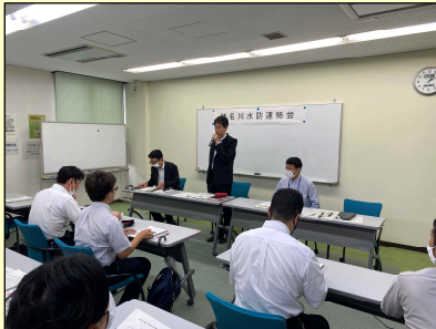
◇緊張感を持って乗り切っていきたい。