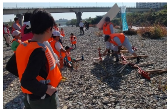
たがやし方の説明