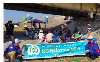
イベントのようす