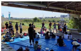
アユについて講義