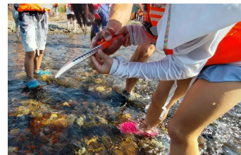
川底の固さを調べる