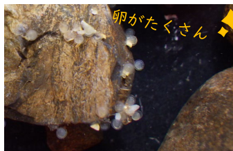
みつかったアユの卵