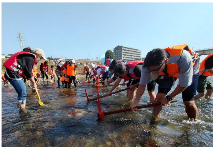
ツルハシなどを使ってたがやすようす