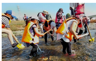
子どもたちががんばるっ！