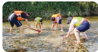
アユが卵をうみやすくするため 河床づくりを体験しよう!!