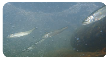
藻川を遡上するアユ

*猪名川・藻川の水質は流域のみなさまのおかげで改善しており、アユも、環境整備を進めることでさらに増える可能性があります。 *今回のイベントでは、川底を掘り返してやわらかくし、アユが産卵・ふ化しやすくします。