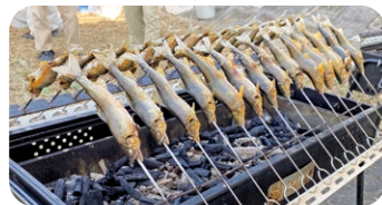
上流でとれたアユを 食べてみよう!!