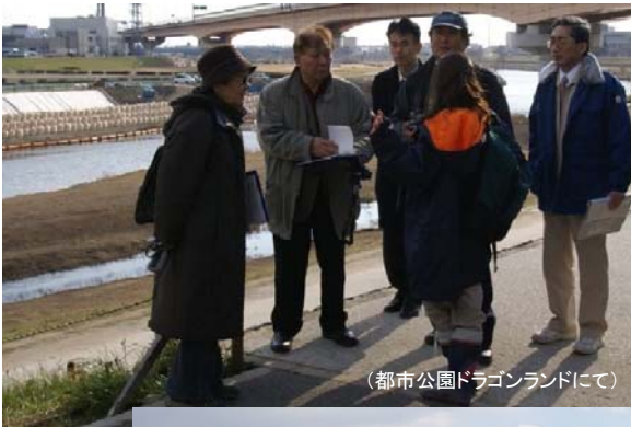
(都市公園ドラゴンランドにて)