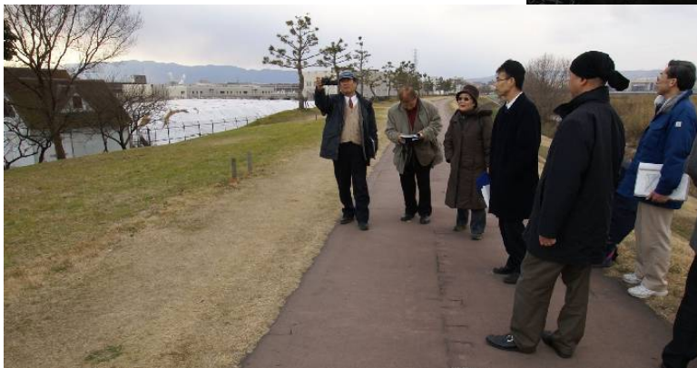
(尼崎市農業公園にて)