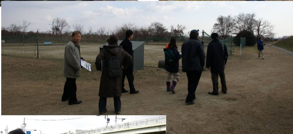
(伊丹市立猪名川テニスコートにて)