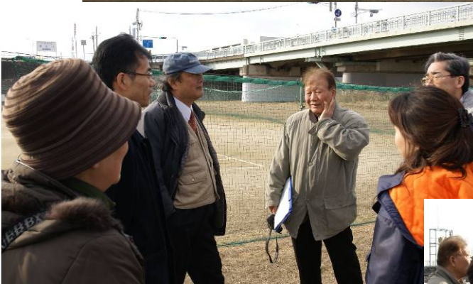
(伊丹市立猪名川テニスコートにて)