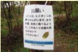
環境看板設置の例