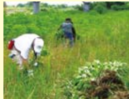
外来植物(オオバクサ)駆除の様子