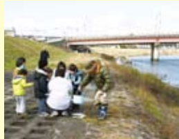
簡易水質調査の様子