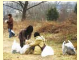
河川清掃(猪名川クリーン作戦)の様子