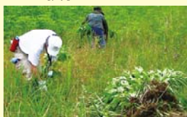
外来植物(オオバクサ)駆除の様子