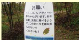
環境看板設置の例