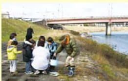
簡易水質調査の様子