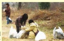
河川清掃(猪名川クリーン作戦)の様子