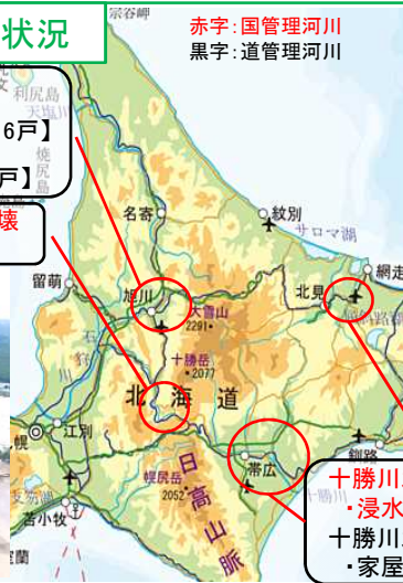
札幌川(帯広市)堤防決壊状況