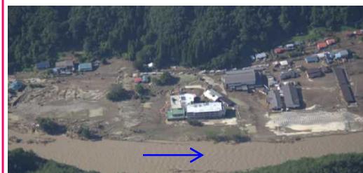
H28. 8. 31撮影 浸水した高齢者利用施設の状況(岩手県岩泉町)

久慈川、川又川、長内川(久慈市) ・越水等により、床上浸水850戸、床下浸水150戸の被害あり