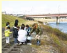
簡易水質調査の様子