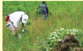
外来植物(オオバクサ)駆除の様子