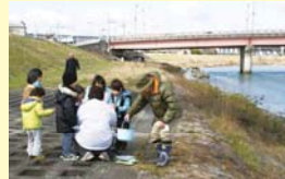
簡易水質調査の様子