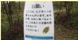
環境看板設置の例