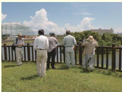
おおぞら広場（尼崎市）