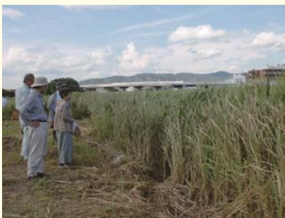
猪名川第1・第2運動公園（伊丹市）