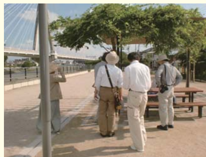
天王宮児童遊園地（川西市）