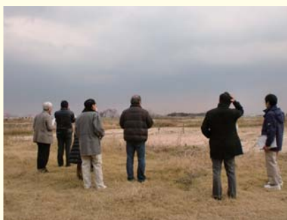
伊丹市立猪名川テニスコート（伊丹市）