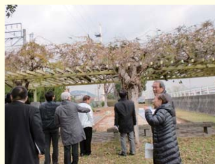
下加茂公園（川西市）