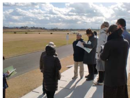
東久代公園（川西市）