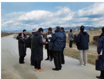
猪名川河川敷緑地（伊丹市）