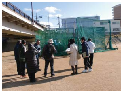
神津運動公園（伊丹市）