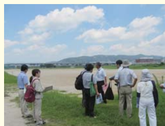
猪名川第1・第2運動公園 (伊丹市)