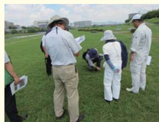
猪名川河川敷緑地 (伊丹市)