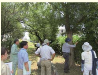
下加茂公園 (川西市)