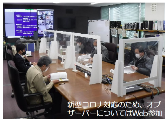
新型コロナ対応のため、オブザーバーについてはWeb参加