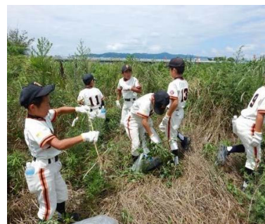
③外来植物駆除体験