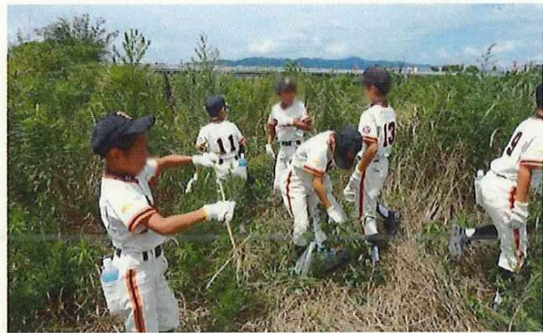
セイタカアワダチソウの駆除「外来植物が多いなあ」