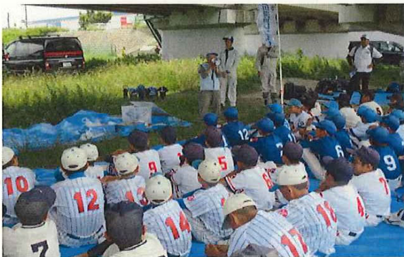
猪名川河川レンジャーが外来植物について説明