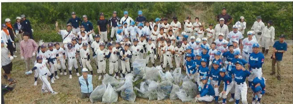
子どもたちと猪名川河川レンジャー「短時間でこれだけ駆除できました！」

【お問合せ先】 国土交通省 近畿地方整備局 猪名川河川事務所 工務課 〒563-0027 大阪府池田市上池田2-2-39 TEL:072-751-1111 (代)