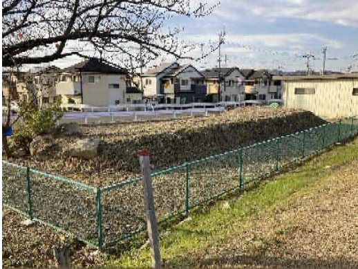
近景（公園側から撮影）