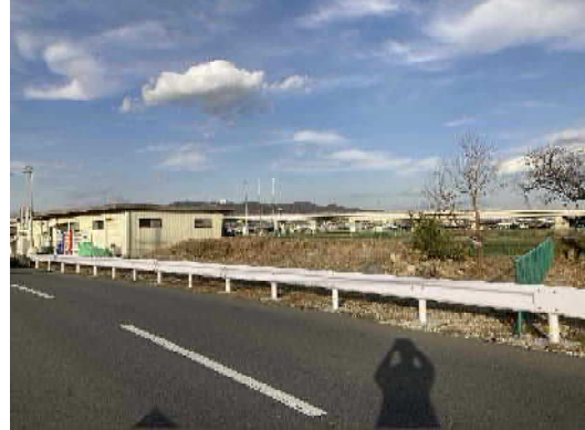
近景（道路側から撮影）