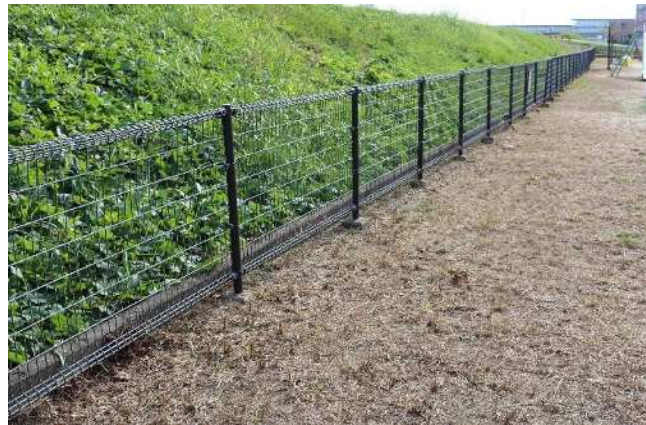
⑥シュロ等の切り株の撤去後の状況