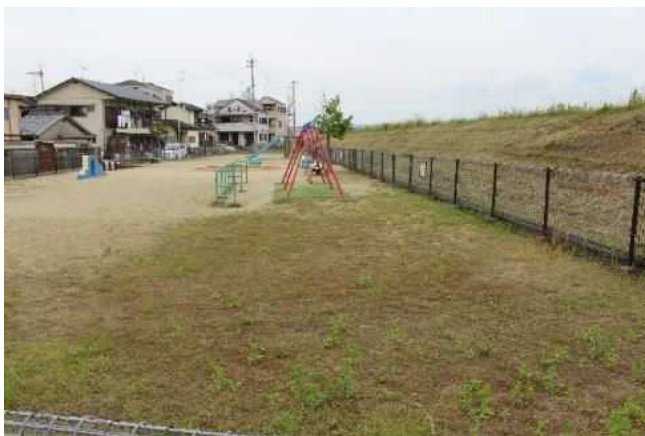
③公園内全景（下流側より）