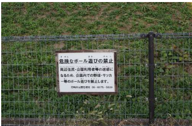
⑤利用ルール注意看板の状況