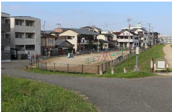
①通路を含めた占用地の全景（下流側より）