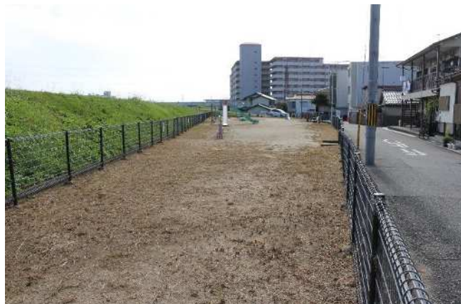
②通路を含めた占用地の全景（上流側より）