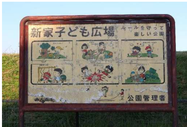
④利用ルール注意看板の状況