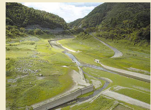
一庫ダム渇水状況（一庫ダムに流入する田尻川の状況）（平成14年8月21日）