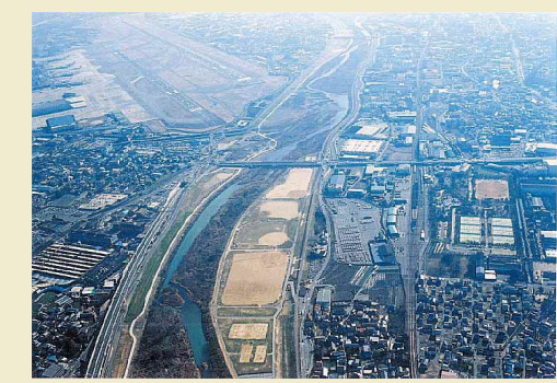
高水敷公園 軍行橋付近（平成15年1月）