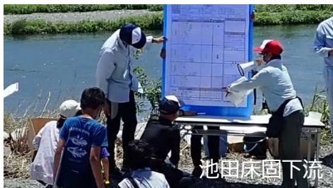
<水生生物調査結果報告>