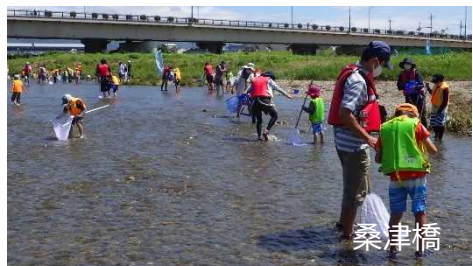
<水生生物調査採取>