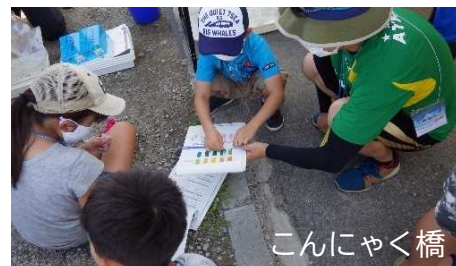
<簡易水質試験（パケットテスト）>

【コロナウィルス感染防止対策】・集合時体温計測・手指アルコール消毒・原則マスク着用