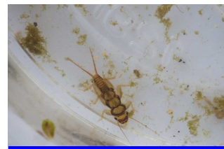
カワゲラ類（指標生物）