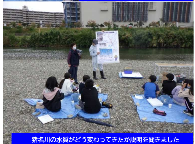
猪名川の水質がどう変わってきたか説明を聞きました