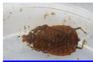
コオニヤンマ（指標生物）