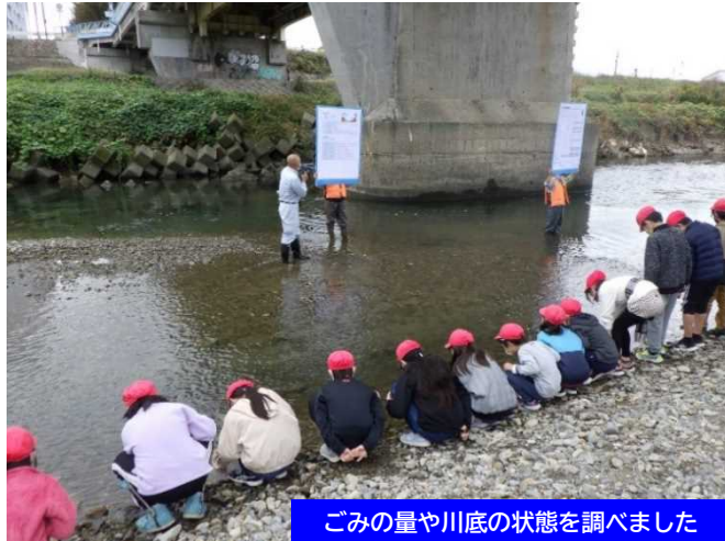
ごみの量や川底の状態を調べました