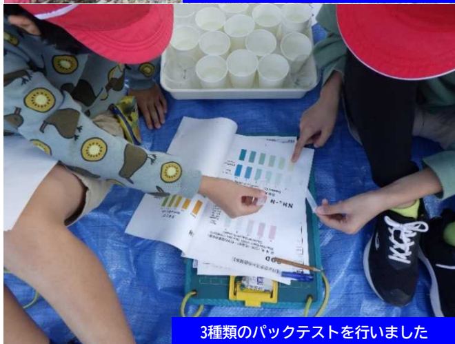
3種類のバックテストを行いました