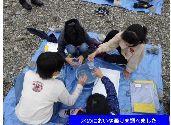
水のおいや濁りを調べました