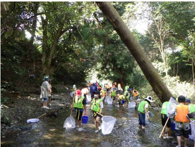
<水生生物採取状況>

日時：令和3年10月5日（火） 9時30分～11時30分 場所：淀川水系初谷川（兵庫県川西市） 参加者：川西市立東谷小学校3年生91名