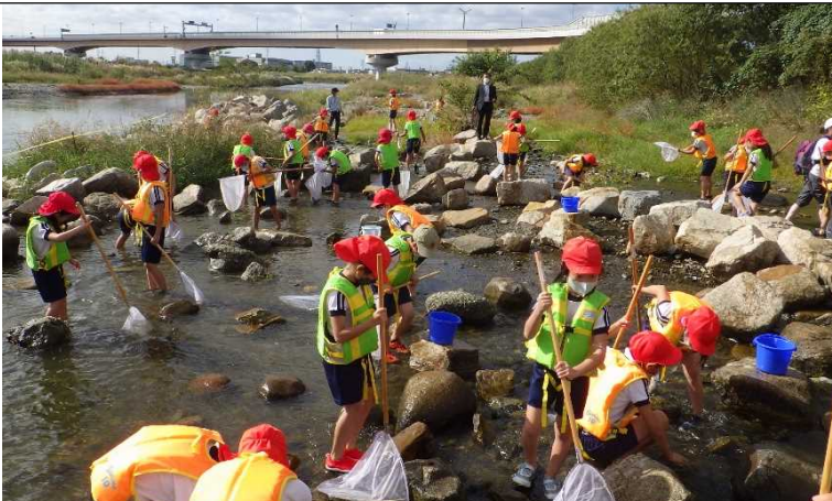
ドラゴンランド公園せせらぎ水路での生物採取

日時：令和3年10月29日（金） 9時00分～11時45分 場所：猪名川右岸10.2kpドラゴンランド公園（兵庫県川西市） 参加者：川西市立川西小学校3年生 77名