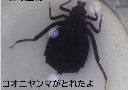
コオニヤンマがとれたよ