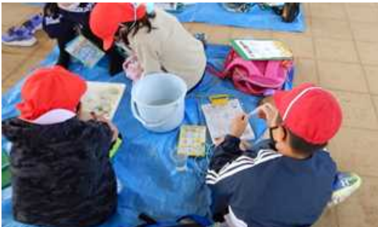
パックテスト（COD：0～2mg/Lでした）